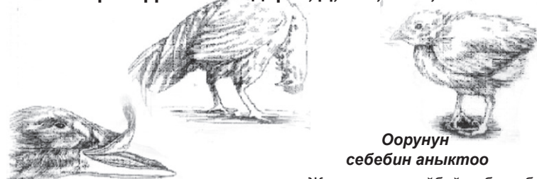
Оорунун себебин аныктоо

Витамин латын тилинде «жашоо» деген мааниде айтылат. Канаттуулардын жеген жеминде витаминдер жетишсиз болсо, канаттуулардын бардык түрү ооруйт. Өтө керектүү витаминдер А, Д, В-1, В-12, Е ж.б.