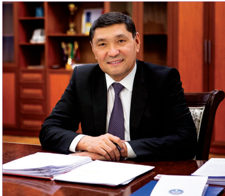
А. С. ДЖАНЫБЕКОВ Кыргыз Республикасынын Айыл чарба министри