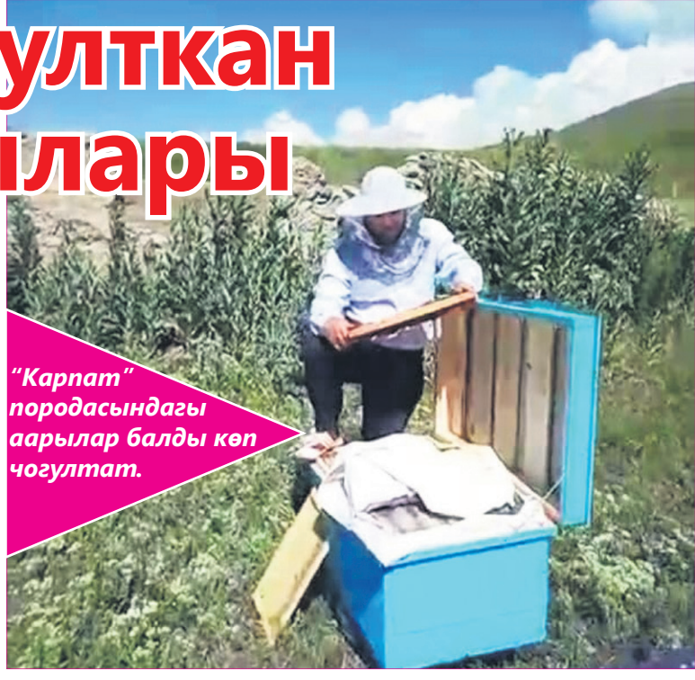
"Карпат" породасындагы аарылар балды көп чогултат.

Төмөндө экономикалык анализ чыгарып көрдүк.